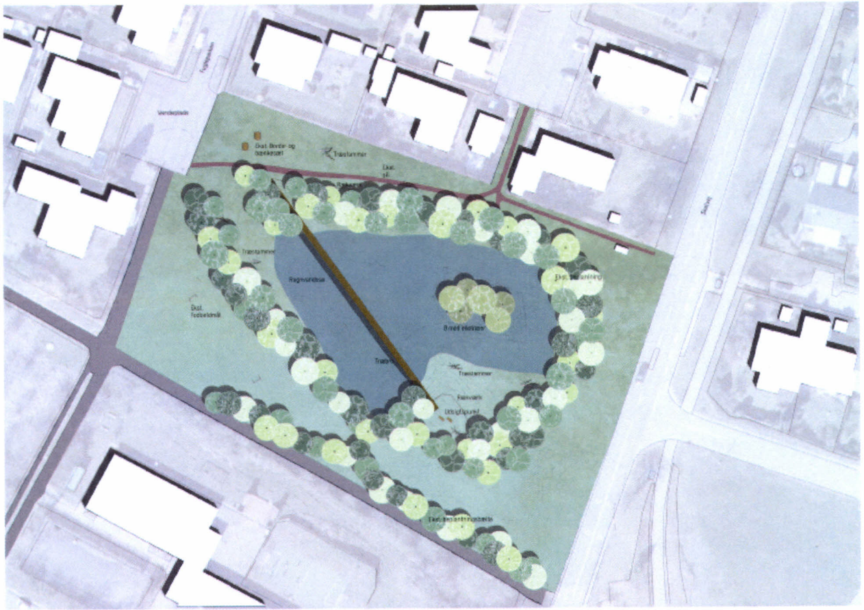
Plantegning forslag 1, 1:1000